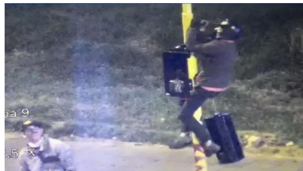
■ Dstrucción de semáforos en el sur de Bogotá. 12 de mayo de 2021.